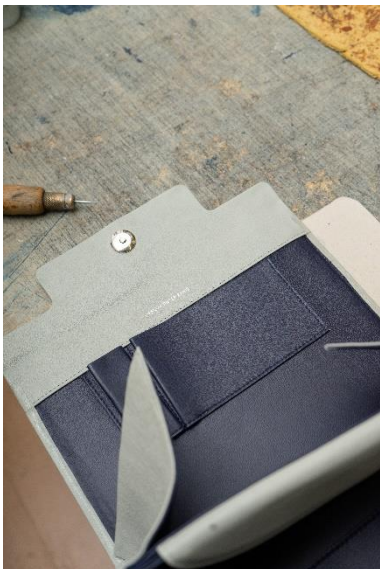
Einblick in die Herstellung der 931, 2018