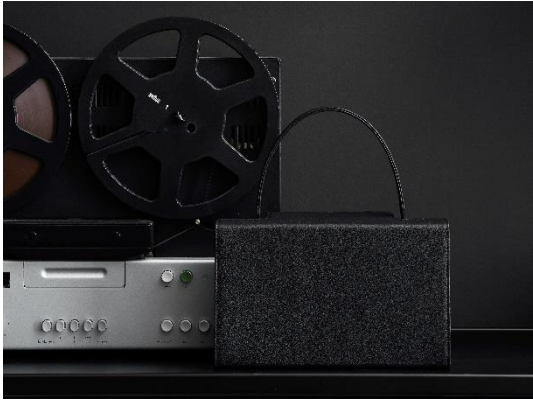
Handtasche 931, Design in Kooperation mit Dieter Rams, Rindleder, 2018 © Gerhardt Kellermann