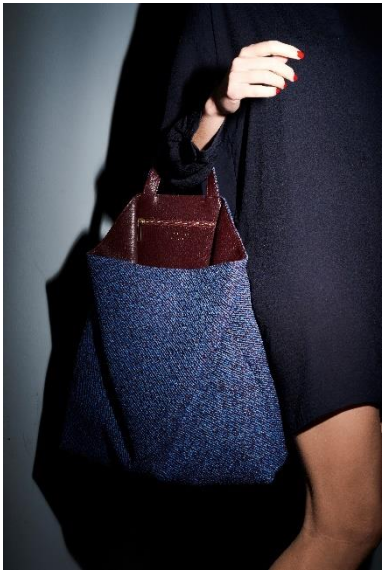
Tasche FLUKE, SO_FAR EDITION 01, Textilien von Raf Simons für Kvadrat, 2017