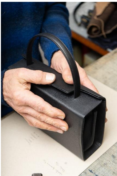
Einblick in die Herstellung der 931, 2018