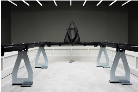
Tasche FLUKE, Rindleder, 2012 © Dimitrios Tsatsas, TSATSAS