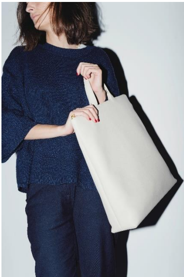
Tasche LUCID, Rindleder, 2012 © Gerhardt Kellermann