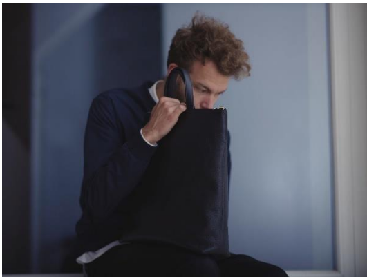
Tasche LUCID, Rindleder, 2012