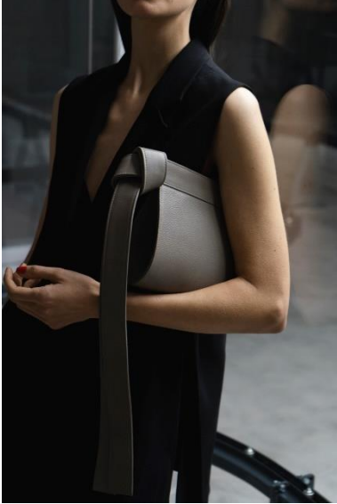
Unterarmtasche TAPE XS, Rindleder, 2017 © Dimitrios Tsatsas, TSATSAS