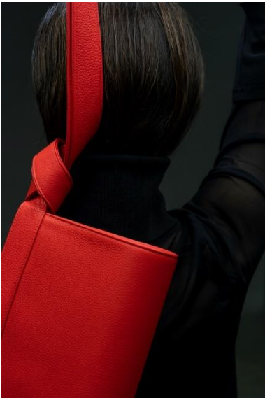
Unterarmtasche TAPE XS, Rindleder, 2017 © Dimitrios Tsatsas, TSATSAS