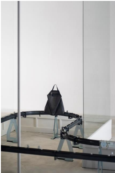
Tasche FLUKE, Rindleder, 2012 © Dimitrios Tsatsas, TSATSAS