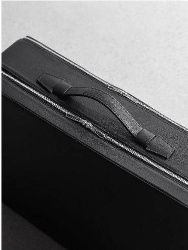
Reisekoffer SUIT-CASE, Design in Kooperation mit Sir David Chipperfield, Rindleder, 2020