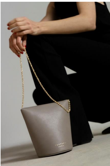
Schultertasche OLIVE, Rindleder, 2019 © Dimitrios Tsatsas, TSATSAS