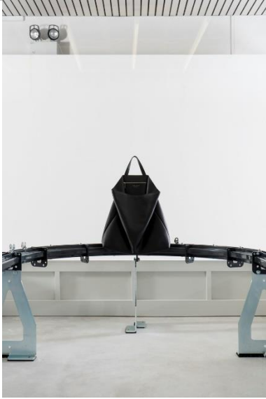
Tasche FLUKE, Rindleder, 2012 © Dimitrios Tsatsas, TSATSAS