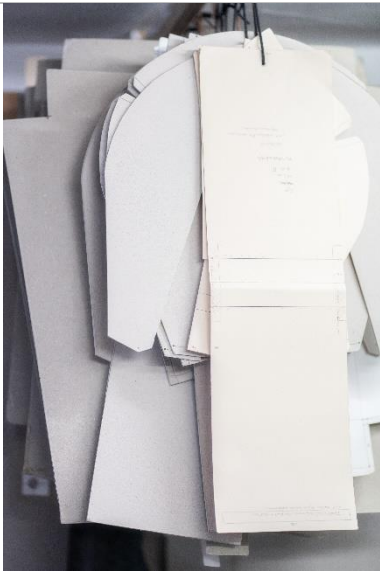
Schnitt- und Arbeitsmuster, 2019 © Dimitrios Tsatsas, TSATSAS