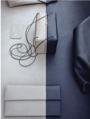
Installation WHERE I END AND YOU BEGIN, Berliner Mode Salon 2016 mit Smartphone- Hülle FOIX, 2016, Schultertasche LINDEN, 2014, Unterarmtasche HAZE, 2014, Rindleder © Dimitrios Tsatsas, TSATSAS