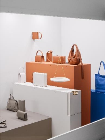
Ausstellungsansicht TSATSAS. Einblick, Rückblick, Ausblick , Laufzeit 1. April 2022 bis 26. März 2023