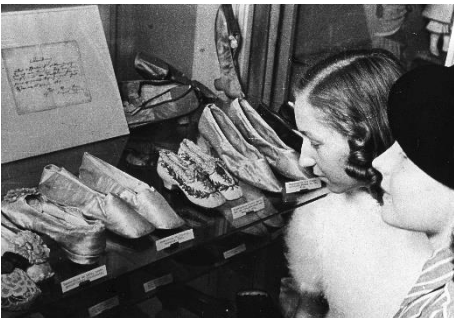
Besucherinnen im Deutschen Ledermuseum, 1943