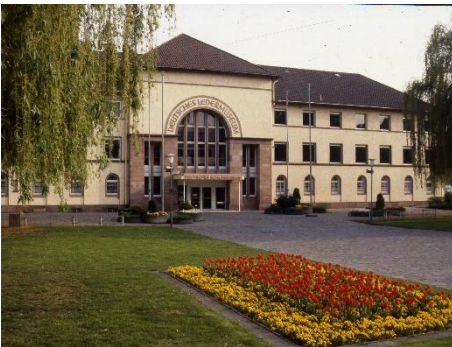
Außenansicht, 1988