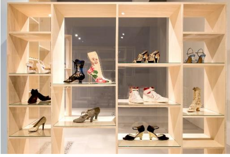
Ausstellungsansicht STEP BY STEP: Schuh.Design im Wandel , Laufzeit 26. Oktober 2019 bis 16. Januar 2022