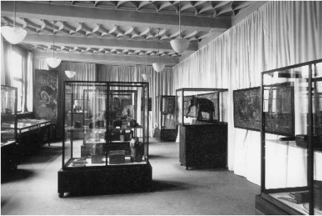
Ausstellung in den Technischen Lehranstalten 1927