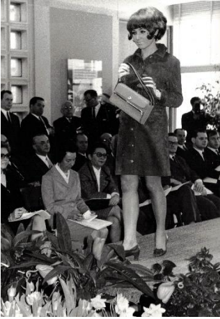
Modenschau anlässlich der Lederwarenmesse, 1967