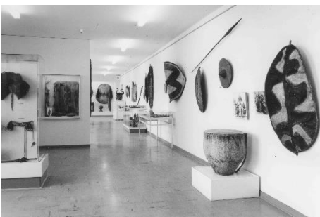
Sammlungspräsentation Afrika, 1967