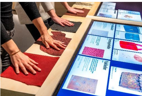
Interaktiver Medientisch im Projektraum DAS IST LEDER! Von A bis Z , eingerichtet 2018