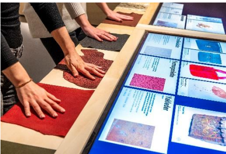
Interaktiver Medientisch im Projektraum DAS IST LEDER! Von A bis Z , eingerichtet 2018