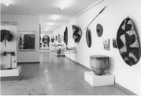
Sammlungspräsentation Afrika, 1967