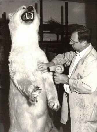
Vorbereitungen zur Ausstellung Leben am Polarkreis , 1993