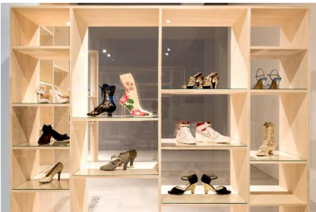
Ausstellungsansicht STEP BY STEP: Schuh.Design im Wandel , Laufzeit 26. Oktober 2019 bis 16. Januar 2022