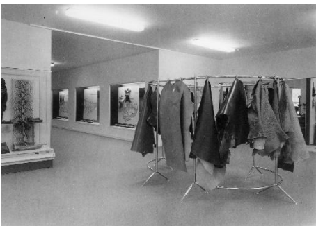
Ausstellung Technische Sammlung, 1961