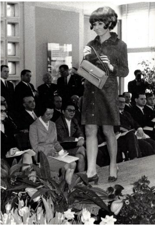
Modenschau anlässlich der Lederwarenmesse, 1967