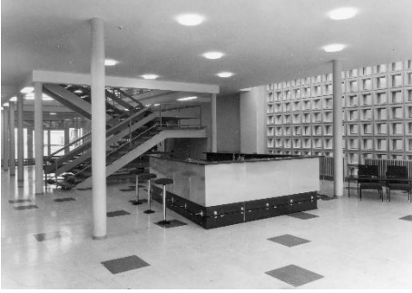
Treppe und Bar im Erdgeschoss, 1962