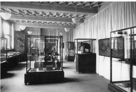
Ausstellung in den Technischen Lehranstalten 1927