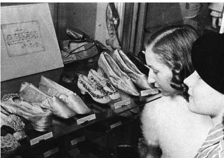
Besucherinnen im Deutschen Ledermuseum, 1943