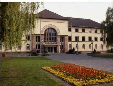
Außenansicht, 1988