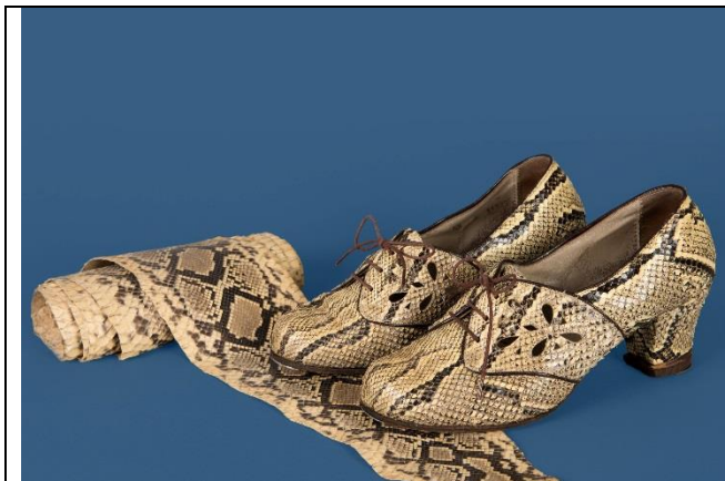
Damenschuhe, Pythonleder, 1940er-Jahre.

Die Pressebilder können Sie von der Website des DLM herunterladen. Passwort: Hugo2017