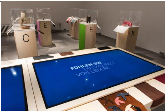
DAS IST LEDER! Von A bis Z Ausstellungsansicht