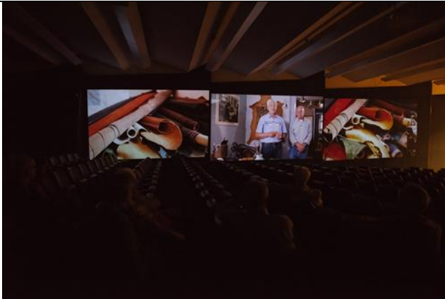
DAS IST LEDER! Von A bis Z Filminstallation