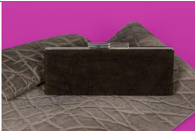
Brillenetui, Elefantenleder, Offenbach, 1970er-Jahre.