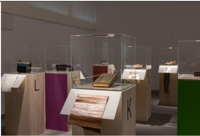
DAS IST LEDER! Von A bis Z Ausstellungsansicht