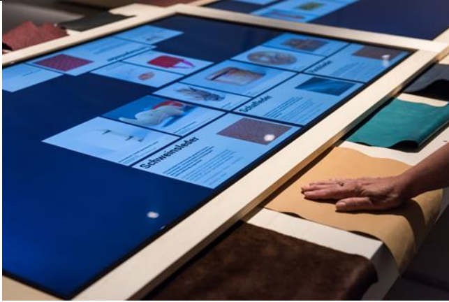
DAS IST LEDER! Von A bis Z Medientisch