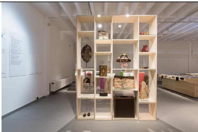
DAS IST LEDER! Von A bis Z Ausstellungsansicht