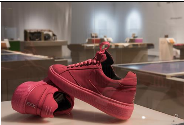
DAS IST LEDER! Von A bis Z Ausstellungsansicht mit Sneaker Gumshoe, Niederlande, 2018, Kooperation von I amsterdam x Explicit Wwar x Gum-Tec. Sneaker mit einer Sohle aus recyclten Kaugummiresten.