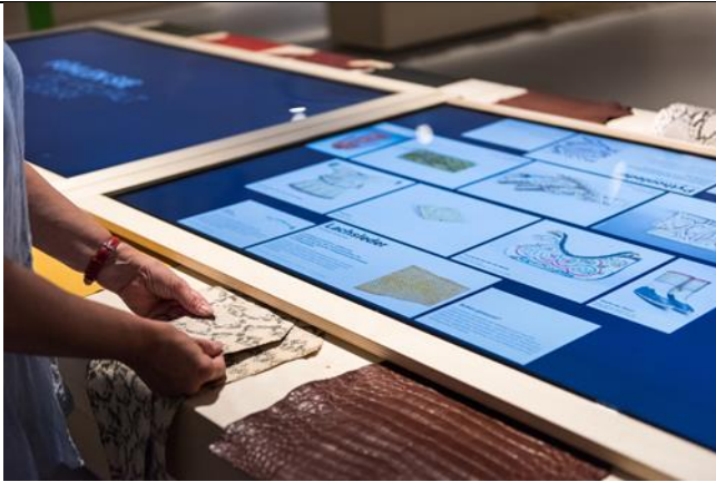
DAS IST LEDER! Von A bis Z Medientisch