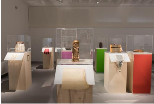
DAS IST LEDER! Von A bis Z Ausstellungsansicht