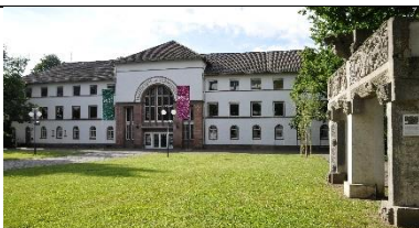
Außenansicht, Deutsches Ledermuseum, Sommer 2017.