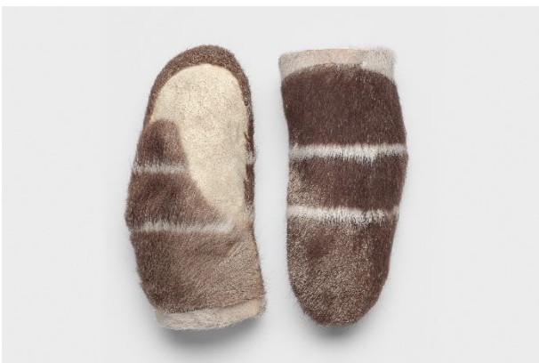
Fausthandschuhe, Northwest Territories, Kanada, um 1940 / Karibupelz