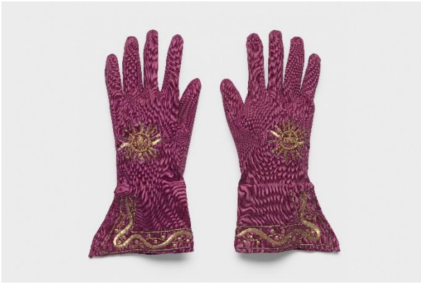
Pontificalhandschuhe, Rom, Italien, vmtl. 18. Jh. / Seidengarn, gestrickt, Metallstickerei, Pailletten