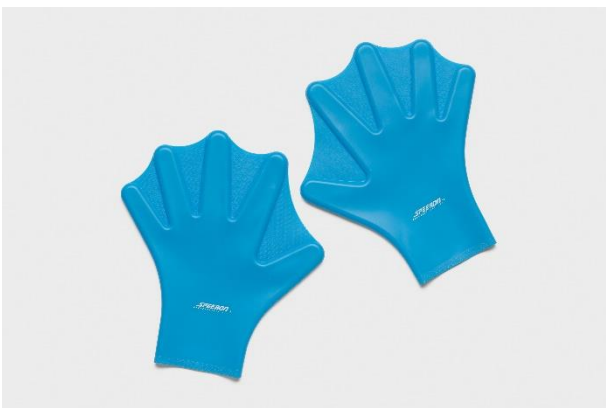
Schwimmhandschuhe, Speeron, o.O., 2021/22 / Gummi