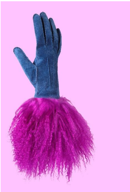
Handschuh, Chanel, Frankreich, 1991 / Schweinsvelours, Fell