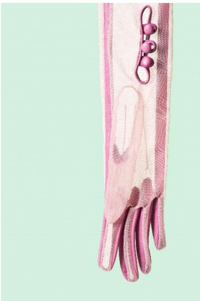
Handschuh, Marc Jacobs für Louis Vuitton in Kollaboration mit Richard Prince, Frankreich, 2008 / Tüll, Lammlleder