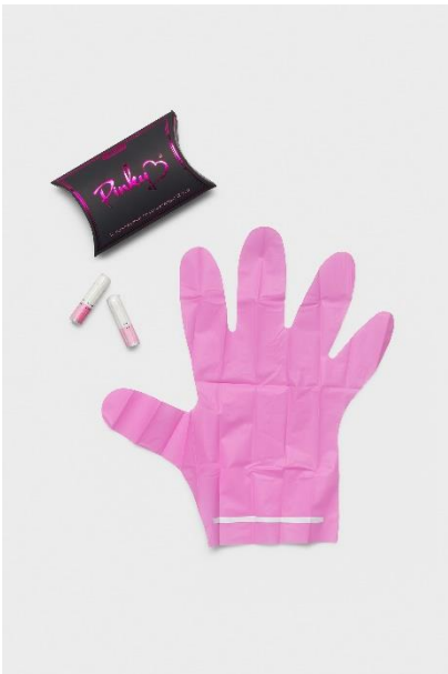
Hygienehandschuh, Pinky Gloves, o. O., 2021 / Kunststoff, Karton