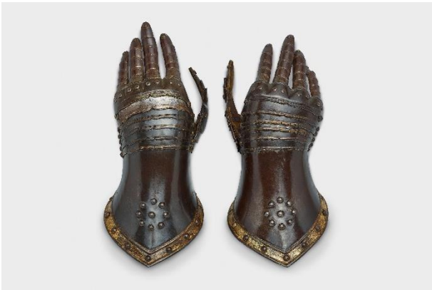
Panzerhandschuhe einer Ritterrüstung, Frankreich oder Deutschland, 1. Drittel 17. Jh. / Eisen oder Stahl, Leder; Leihgabe des Hessischen Landesmuseums Darmstadt, Inv.-Nr. W 61:278 (zugehörig)