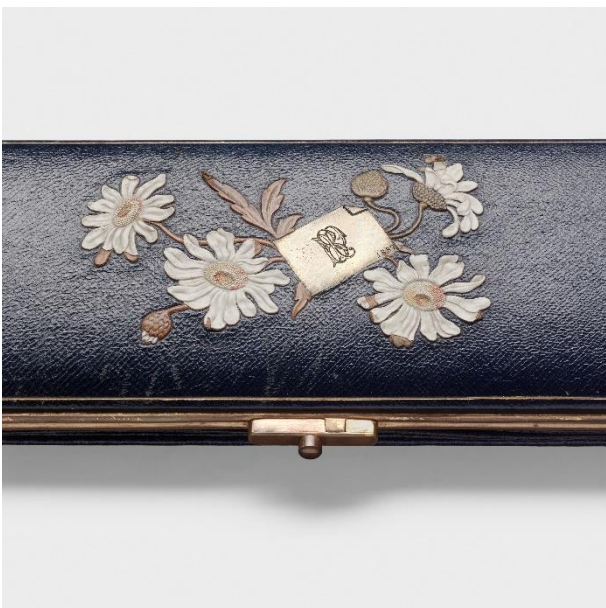
Handschuhkasten (Detail), Europa, 1887 / Leder, Goldprägung, Celluloid, Messing, Seidenfutter