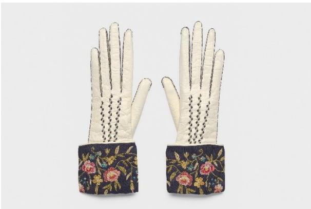
Handschuhe mit Umschlagstulpen, Fa. Maurice Vallet, Paris, Frankreich, 1910/20er-Jahre / Leder, Seidenrips, Tambourstickerei