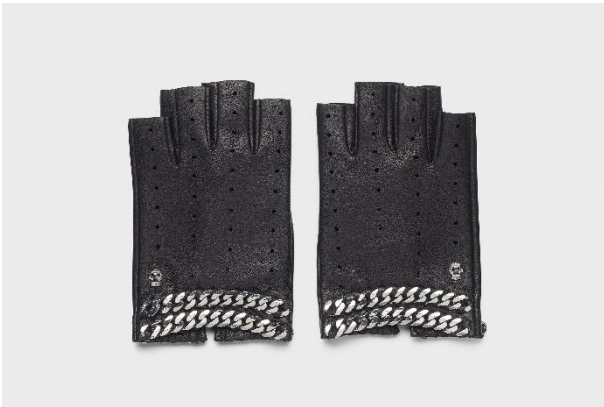
Halbfingerhandschuhe, Tribute to Karl, ROECKL, Indien, 2022 / Nappaleder, Metall, Textil