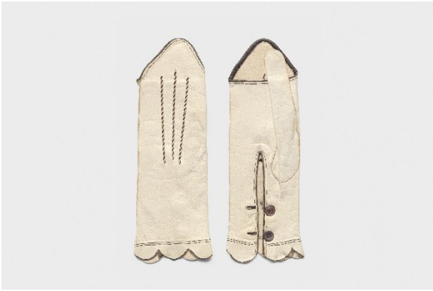
Halbhandschuhe, Fa. M. & P. Händel, Grimma, 1908 / Schafleder, Tambourstickerei, Perlmutter