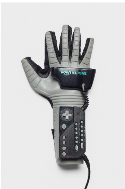
POWER GLOVE für die Spielekonsole Nintendo Entertainment System, Mattel, Kalifornien, USA, 1989 / Kunststoff, Textil, Metall; Leihgabe des Digital Retro Park, Offenbach am Main