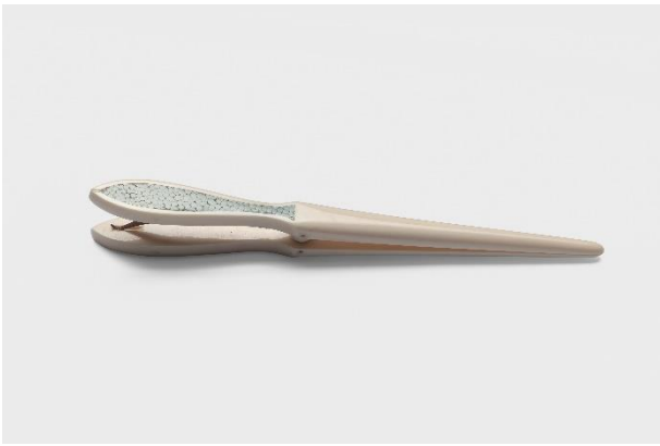
Handschuhdehner, Frankreich, 1920-1930 / Elfenbein, mit Rochenleder bezogen