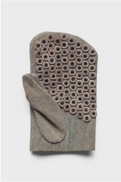
Arbeitshandschuh, Fa. Johann Duttiné, Mühlheim am Main, um 1960 / Rauleder, perforiert, Metall