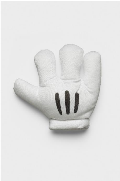
Jumbo Maus Handschuh, ORLOB Karneval, China, 2021/22 / Polyester, gefüttert, wattiert