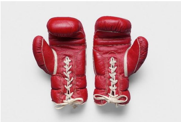
Boxhandschuhe von Max Schmeling, Deutschland, um 1970 / Rindleder, Baumwollfutter, Wattierung, textile Bindebänder, Kunststoff, signiert