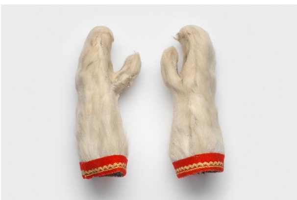
Fausthandschuhe, Christina Utsi, Lappland, Schweden, um 1975 / Obermaterial: Rentierpelz, Filz; Futter: Textil