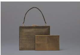
Damen­hand­tasche und Unterarmtasche, Josef Hoffmann, Wiener Werkstätte, Wien, 1911.