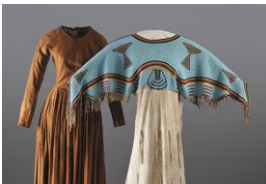
Siedler­frauen­kleid, Nordamerika, 1875–1880; Fest­kleid der Lakota, Nordamerika, um 1870.