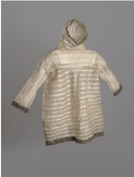
Parka, Aleuten, Arktis, vor 1874.