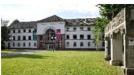
Deutsches Ledermuseum, Außenansicht, 2017.