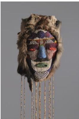
Stülp­maske der Tabwa, Dem. Rep. Kongo, o. J.