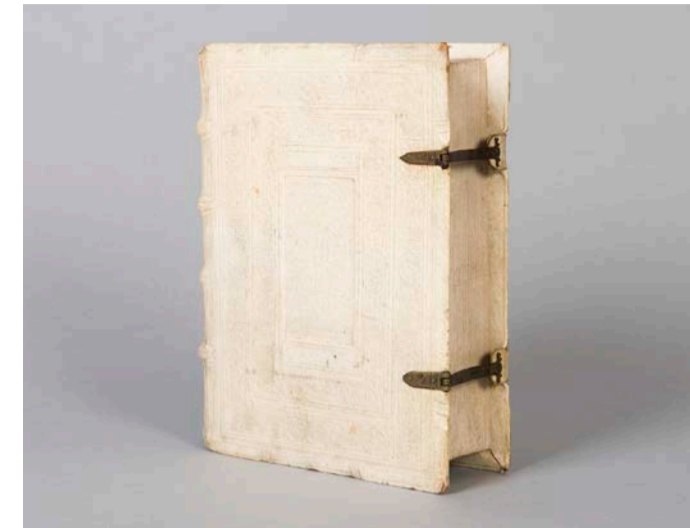
Bucheinband, Süddeutschland, 1582

Charakteristische Eigenschaften, Gestaltungstechniken und viele weitere Informationen können per Touch-Funktion an Medientischen abgerufen werden. Kurzfilme mit ehemaligen und gegenwärtigen Akteur*innen lederverarbeitender Betriebe bieten zudem Einblicke in Handwerk und Produktion einer Region, die wie keine andere durch die Lederbranche geprägt wurde.