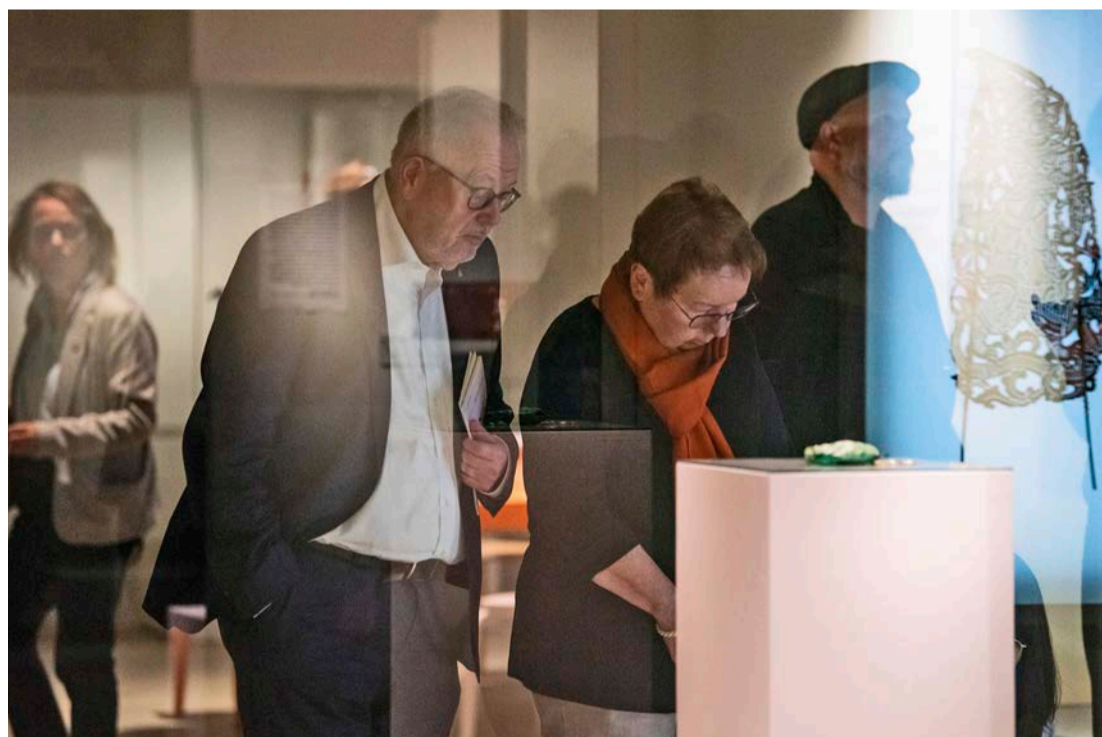
Nacht der Museen

S-Bahn S1, S2, S8 und S9 Station Ledermuseum, Ausgang Ludwigstraße Buslinien 103 und 120 Haltestelle Offenbach, Ludwigstraße/Ledermuseum Parkmöglichkeiten im City-Center Parkhaus am CinemaxX, Berliner Str. 206-216