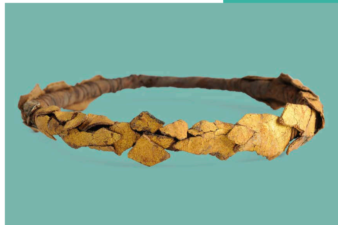
Totenkranz, Achmim-Panopolis, Ägypten, 1.-3. Jh. n. Chr.

Führungen und Workshops finden ab mindestens zwei Personen statt. Wir bitten um Anmeldung bis spätestens 16:00 Uhr am Vortag der Veranstaltung.