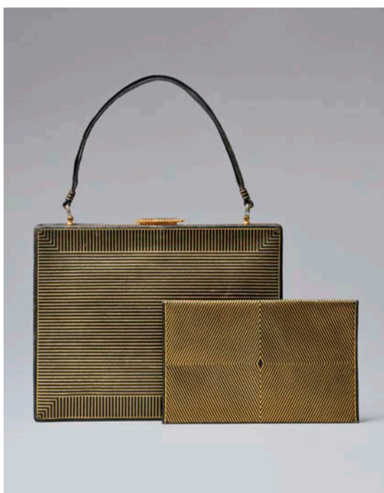
Handtasche und Unterarmtasche, Josef Hoffmann, Wien, 1911