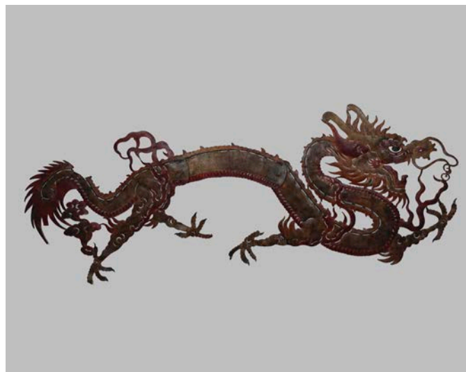
Schattenfigur Drache, Sichuan, China, o. J.