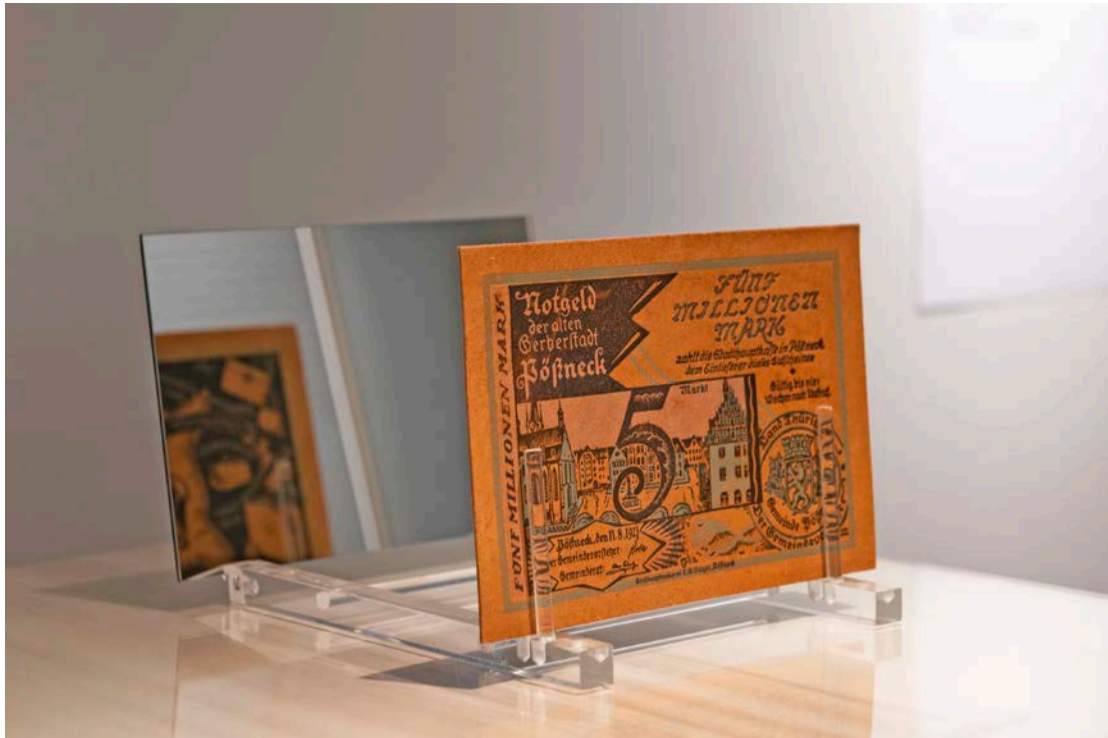
In der Ausstellung DEIN MUSEUM. Sammlung neu gesehen, Notgeld, 5 Millionen Mark, Grafiker Kühlborn für die Großbuchdruckerei C. G. Vogel, Poßneck, 1923