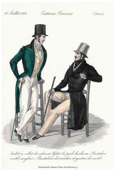
Journal des Dames et des Modes, Costumes Parisiens, 1832

bis 18:00 Uhr; 40 € plus 10 € Materialkosten; mit Anmeldung*