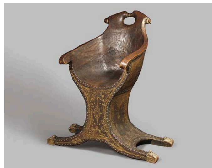
Gondelstuhl, Venedig, Italien, 2. Hälfte 18. Jh.