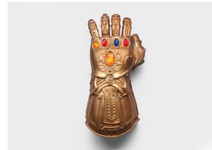
Kostümhandschuh für Kinder, Marvel Avengers Infinity Gauntlet, NUWIND, China, 2018/19

Über 90 Exponate verweisen auf die Bedeutung von Handschuhen etwa als Teil von Sportausrüstungen, im Arbeitsschutz oder in der Mode. Werkzeuge und Utensilien der Handschuhproduktion gewähren überdies Einblicke in das bis zu Beginn des 19. Jahrhunderts rein manuell betriebene Handwerk.