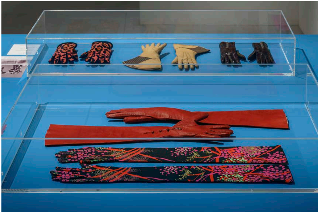
In der Ausstellung DER HANDSCHUH: Mehr als ein Mode-Accessoire, Kapitel HANDSCHUHMODEN