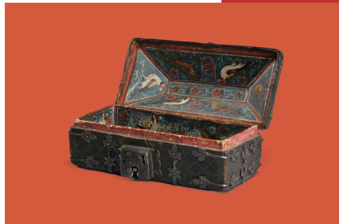
Minnekästchen, Deutschland, 15. Jh.

* gefördert durch die KulturRegion FrankfurtRheinMain