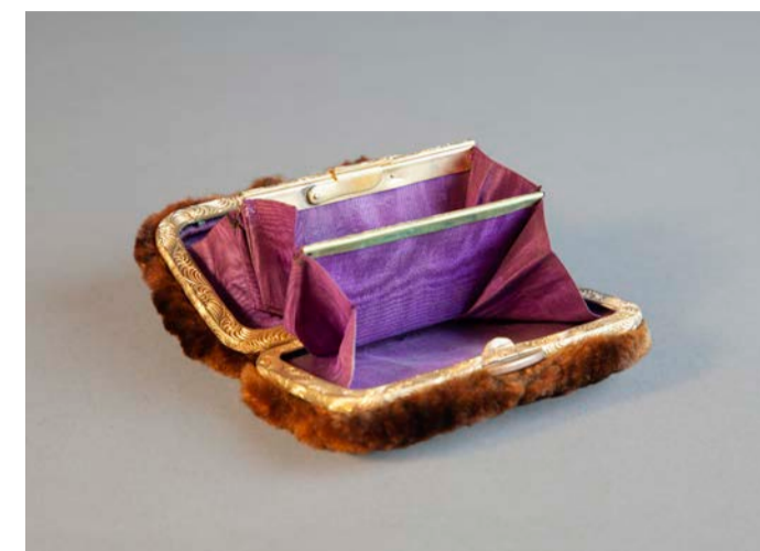
Portemonnaie, Offenbach am Main, um 1905

Exponate aus verschiedenen Zeiten und Kulturen verdeutlichen darüber hinaus die Verwendung und die Gestaltungsweisen der Werkstoffe. Medientische geben überdies Einblicke in lederverarbeitende Berufe und Themen wie Artenschutz oder Umwelt- und Nachhaltigkeitsaspekte.