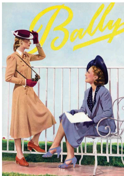
Plakat, Bally, o. Nr., Schönenwend, Schweiz, o. O., Deutsches Ledermuseum

Führungen und Workshops finden ab mindestens zwei Personen statt. Wir bitten um Anmeldung bis spätestens 16:00 Uhr am Vortag der Veranstaltung.