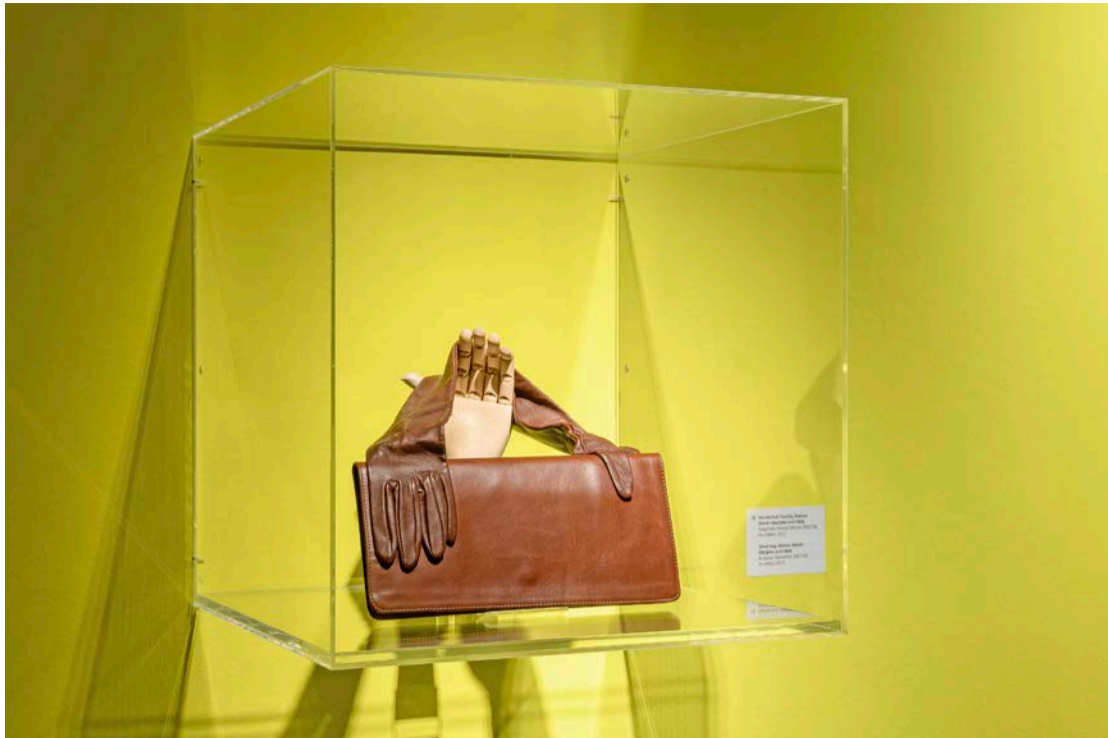
Handschuh-Tasche, Maison Martin Margiela und H&M, Bulgarien, Herbst/Winter 2007/08, Re-Edition 2012