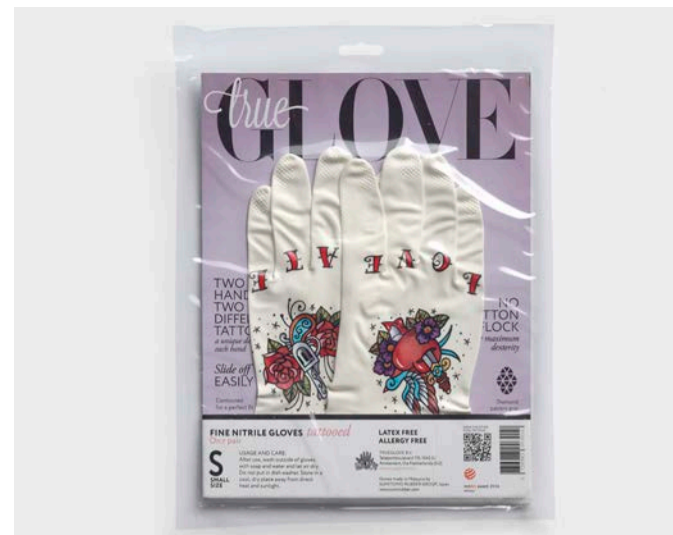
Haushaltshandschuhe, tattooed Love/Hate, Sumitomo Rubber Industries für TRUEGLOVE, Malaysia, 2020/21