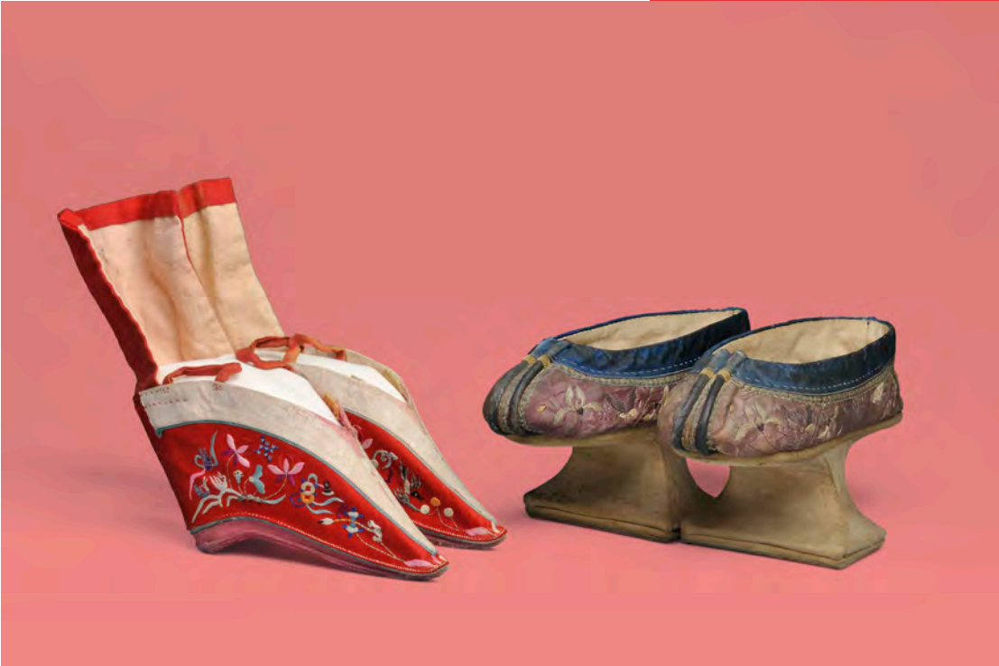
Gin-Lien-Schuhe, China, um 1900 und Mandschu-Stelzschuhe, China, Anfang 19. Jahrhundert

SA 28 FEB 14:00 LEDER-SPRECHSTUNDE SAMSTAGSWERKSTATT FÜR ERWACHSENE Expertin Saskia Buschbaum teilt Wissenswertes zur Anwendung und Pflege verschiedener Lederarten und zeigt den fachgerechten Umgang mit Werkzeugen für diverse Lederarbeiten. Bei einer Tasse Kaffee oder einem erfrischenden Getränk entsteht Raum für persönliche Gespräche. Anschließend gibt es Einblicke in den Projektraum DAS IST LEDER! Von A bis Z. bis 16:00 Uhr; 15 €; mit Anmeldung*