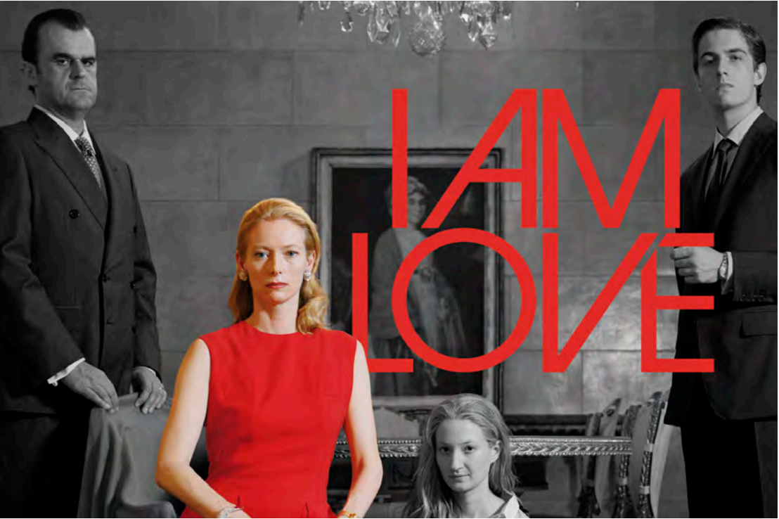
Film I AM LOVE

Ermöglicht wird die Ausstellung durch die Förderung der Dr. Marschner Stiftung. Zudem unterstützt die Hessische Kulturstiftung das Ausstellungsprojekt. Außerdem kommen Mittel aus dem Förderkreis des Deutschen Ledermuseum e.V. der Ausstellung zugute.