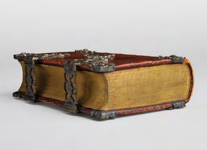
Lutherbibel, Frankfurt am Main und Leipzig, 1761

So trifft zum Beispiel eine Punker-Lederjacke, stellvertretend für die rebellische Jugendkultur, aus den 1980er Jahren auf eine Polizeijacke, die bei der Demonstration gegen den Bau der Startbahn West des Frankfurter Flughafens im Jahr 1980 mit einem Farbbeutel beworfen wurde.