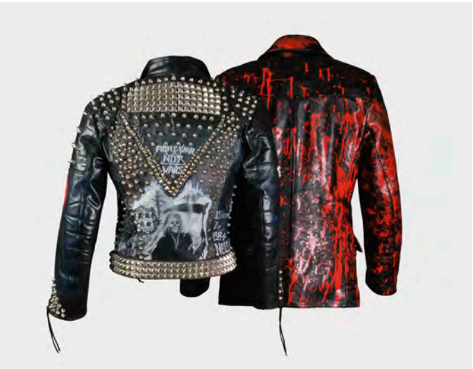
Punker-Lederjacke, Deutschland, 1980er Jahre und Polizeijacke, Striwa International, Deutschland, 1980

S-Bahn S1, S2, S8 und S9 Station Ledermuseum, Ausgang Ludwigstraße Buslinien 103 und 108 Haltestelle Offenbach, Ludwigstraße/Ledermuseum Parkmöglichkeiten im City-Center Parkhaus am CinemaxX, Berliner Str. 206–216