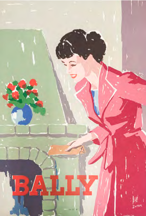
Werbeplakat, Fa. Bally, Nr. 24, 1949