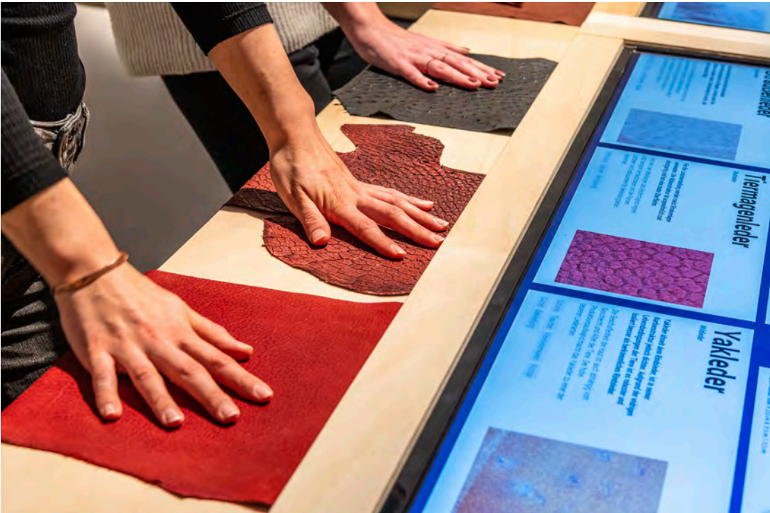
Im Projektraum DAS IST LEDER! Von A bis Z

MO 5 – 9 JAN 9:00 KREATIV IN DEN FERIEN WINTERWERKSTATT FÜR KINDER Nach einem spannenden Rundgang durch die Ausstellung immer dabei: DIE TASCHE gestalten Kinder eigene Accessoires – vom kleinen Lederbeutel bis zum Schmuckstück. Fertige Teile können kreativ bemalt und verziert werden. Den Abschluss bildet eine Modenschau mit den selbst gestalteten Outfits vor Familie und Freund*innen. bis 13:00 Uhr; 6 bis 12 Jahre; kostenfrei; mit Anmeldung*