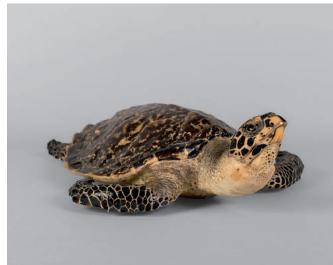
Präparat einer Schildkröte, Philippinen, 1980er Jahre