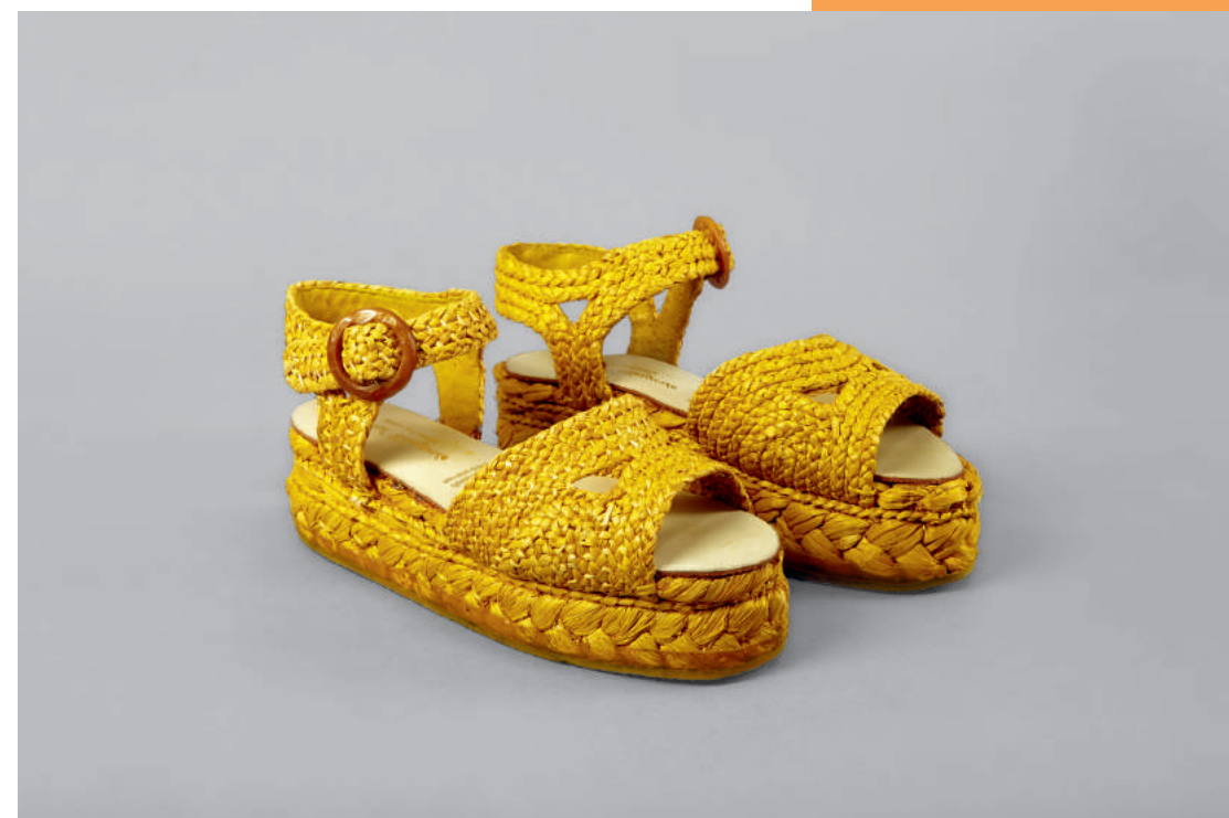
Plateausandalen, BANGKOK, Robert Clergerie, Frankreich 1993