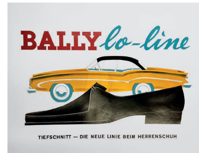
Plakat, Bally, Nr. 83, Schönenwerd, Schweiz, 1955, DLM © Bally Schuhfabriken AG

Über 150 ausgewählte Schuhpaare zeugen sowohl von Kontinuitäten als auch Brüchen in der Entwicklung des Schuhs wie des Schuhdesigns. Historische Exponate werden bewusst mit Exemplaren aus der zweiten Hälfte des 20. bzw. des 21. Jahrhunderts kombiniert. So steht eine Stelzsandale aus Damaskus aus dem 19. Jahrhundert einer Adilette gegenüber, die adidas 1972 als wasserunempfindliche Duschsandale entwickelte.