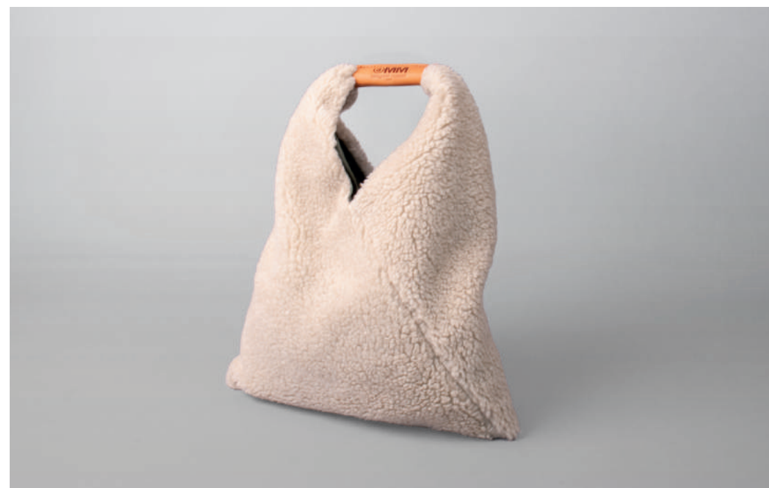
Schultertasche, JAPANESE, MM6 Maison Margiela, Italien, 2020

S-Bahn S1, S2, S8 und S9 Station Ledermuseum, Ausgang Ludwigstraße Buslinien 103 und 120 Haltestelle Offenbach, Ludwigstraße/Ledermuseum Parkmöglichkeiten im City-Center Parkhaus am CinemaxX, Berliner Str. 206-216