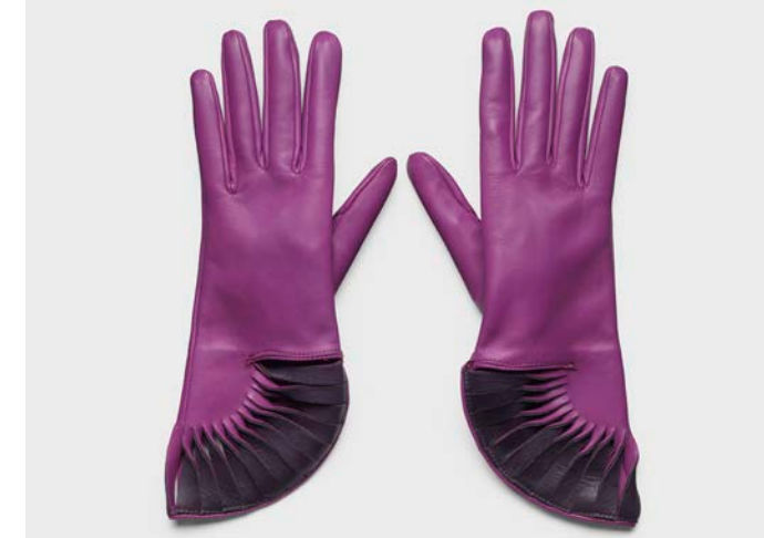
Handschuhe, PARIS parfumé, THOMASINE, Ungarn, 2021/22

Wärmende Fäustlinge der Inuit, Boxhandschuhe, Einweghandschuhe aus Gummi oder Latex sowie Pontifikalhandschuhe und Modelle namhafter Designer*innen wie Marc Jacobs und Dries Van Noten beleuchten neben Fertigungsweisen, Materialwahl und Zubehör den Facettenreichtum eines unterschätzten Accessoires.