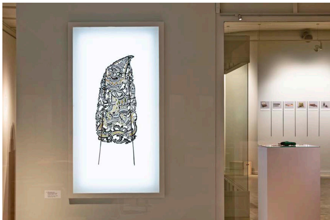
Blick in die Ausstellung DEIN MUSEUM. Sammlung neu gesehen, Bereich EINGELADENE