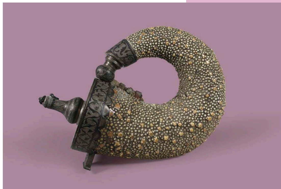
Pulverhorn mit Sternrochenleder, Russland, 1795

Führungen und Workshops finden ab mindestens zwei Personen statt. Wir bitten um Anmeldung bis spätestens 16:00 Uhr am Vortag der Veranstaltung.