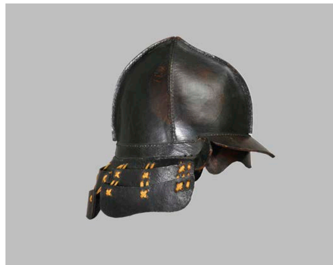
Feuerwehrhelm, Japan, Edo-Zeit, 17./18. Jh.