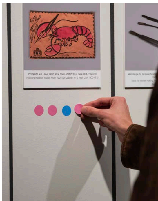
In der Ausstellung DEIN MUSEUM. Sammlung neu gesehen, Bereich OBJEKTWahl

Zum Abschied lockt ein amüsantes Quiz am letzten Öffnungstag in die Ausstellung DER HANDSCHUH: Mehr als ein Mode-Accessoire . Alle Teilnehmer*innen, die ausgewählte Fragen zum Handschuh richtig beantwortet, haben die Chance einen Muff in der Farbe Hellblau aus dem Atelier von Hans Schwarz Pelze in Frankfurt am Main im Wert von 395 Euro zu gewinnen. bis 18:00 Uhr; im Eintritt inbegriffen