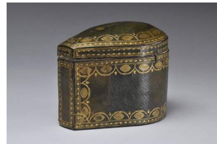
Schmucktui der Kaiserin Joséphine, Frankreich, um 1805