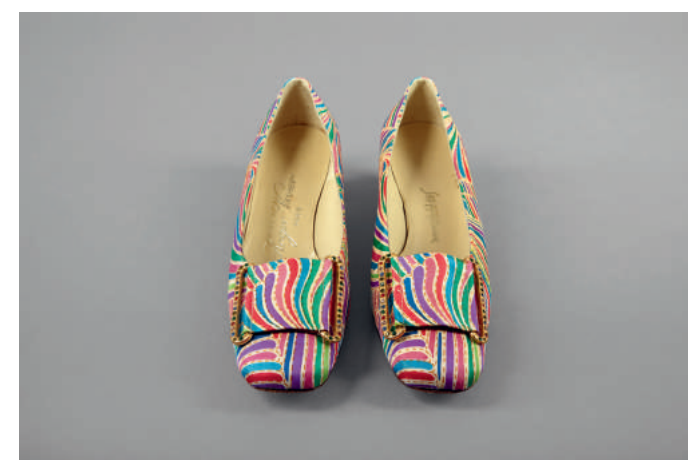
Pilgrim-Pumps, Roger Vivier für Saks Fifth Avenue, Paris, Frankreich, um 1965

Die Pilgrim-Pumps von Roger Vivier, eine*in der bekanntesten Schuhdesigner*innen des 20. Jahrhunderts, wirkten beispielsweise in den 1960er-Jahren daran mit, die spitz zulaufenden, hohen Stiletto-Pumps durch legeres Schuhwerk abzulösen. Die kennzeichnende Schnalle, zugleich eines von Viviers Markenzeichen, war durch die Schuhschnallen der amerikanischen Puritaner*innen des 17. Jahrhunderts inspiriert.