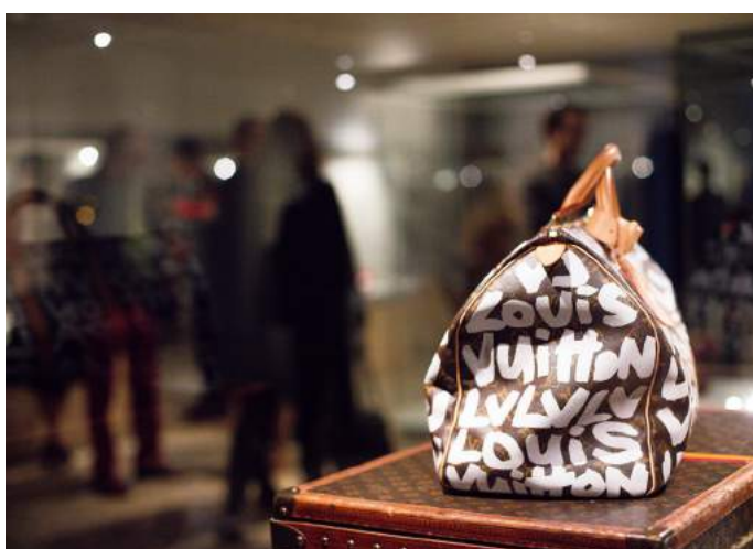
Ausstellungsansicht LEDER.WELT.GESCHICHTE. 100 JAHRE DEUTSCHES LEDERMUSEUM (1917-2017)