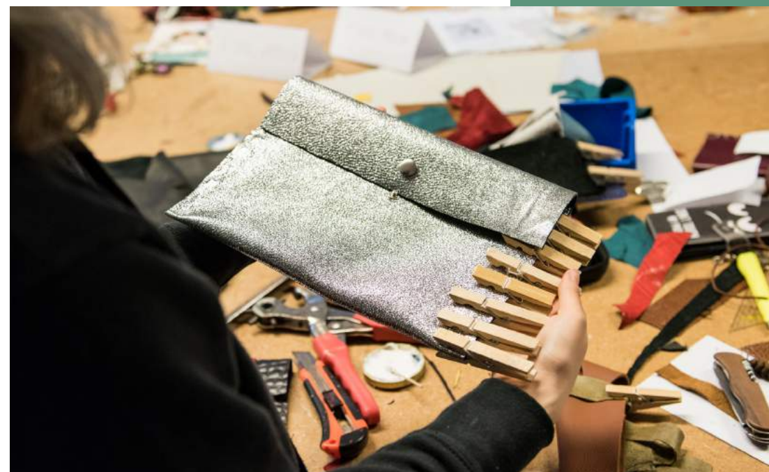
Leder-Workshop im Deutschen Ledermuseum