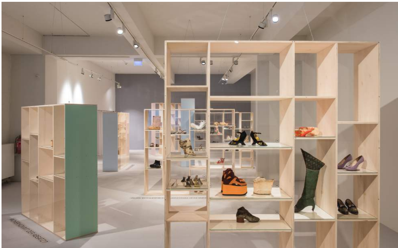
Blick in die Ausstellung STEP BY STEP: Schuh.Design im Wandel