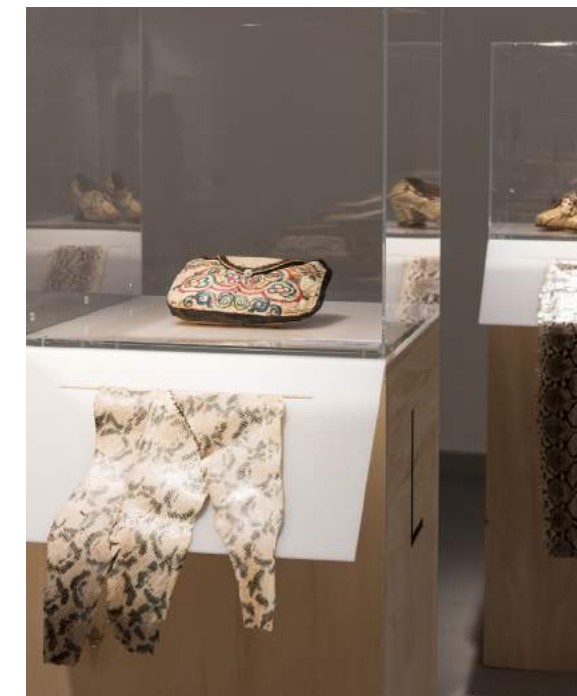
Projektraum DAS IST LEDER! Von A bis Z

Anmeldung bitte bis 16. März 2020 unter Tel. 069 829798-0 oder info@ledermuseum.de .