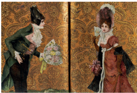
Doppelalbum, Offenbach am Main, um 1890