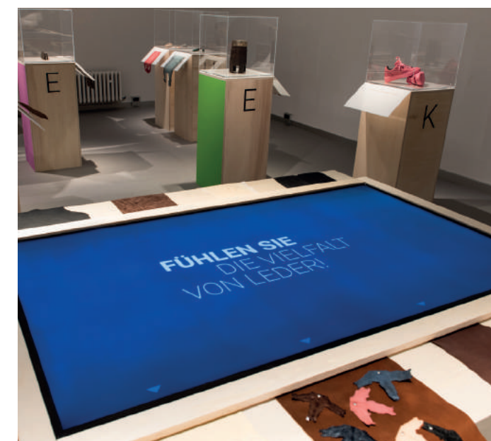
Medientisch und Fühlstationen im Projektraum DAS IST LEDER! Von A bis Z

In einer dazugehörigen Filminstallation berichten lokale Akteur*innen ausgewählter lederverarbeitender Betriebe aus der Stadt und aus dem Kreis Offenbach über Handwerk und Tradition, verschiedene Fertigungsprozesse sowie über die Rolle von Moden und Trends.