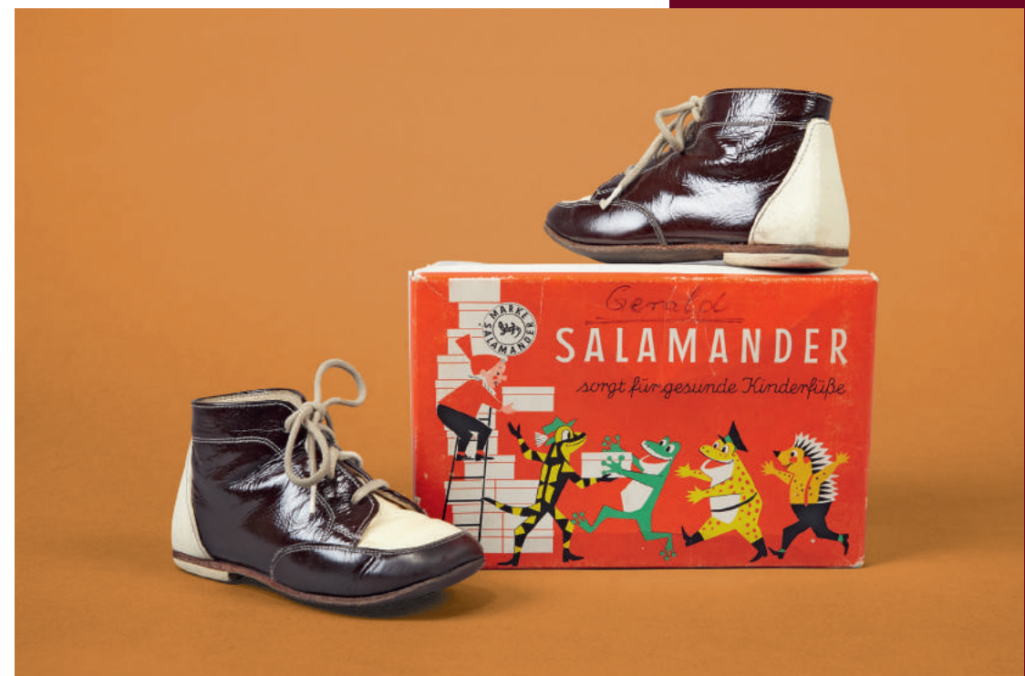
Kinderschuhe, Salamander, Kornwestheim, 1969/70

SO 21 JUN 11:00 SCHUHE IM HANDEL Leder im Wandel Eine Gesprächsreihe des DLM