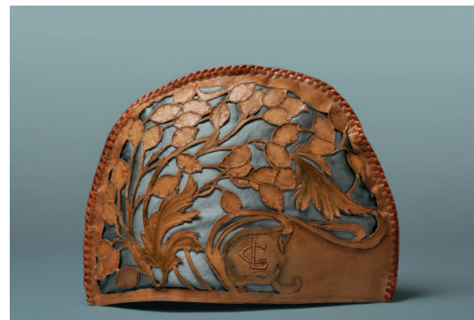
Teewärmer, Frankreich, um 1900