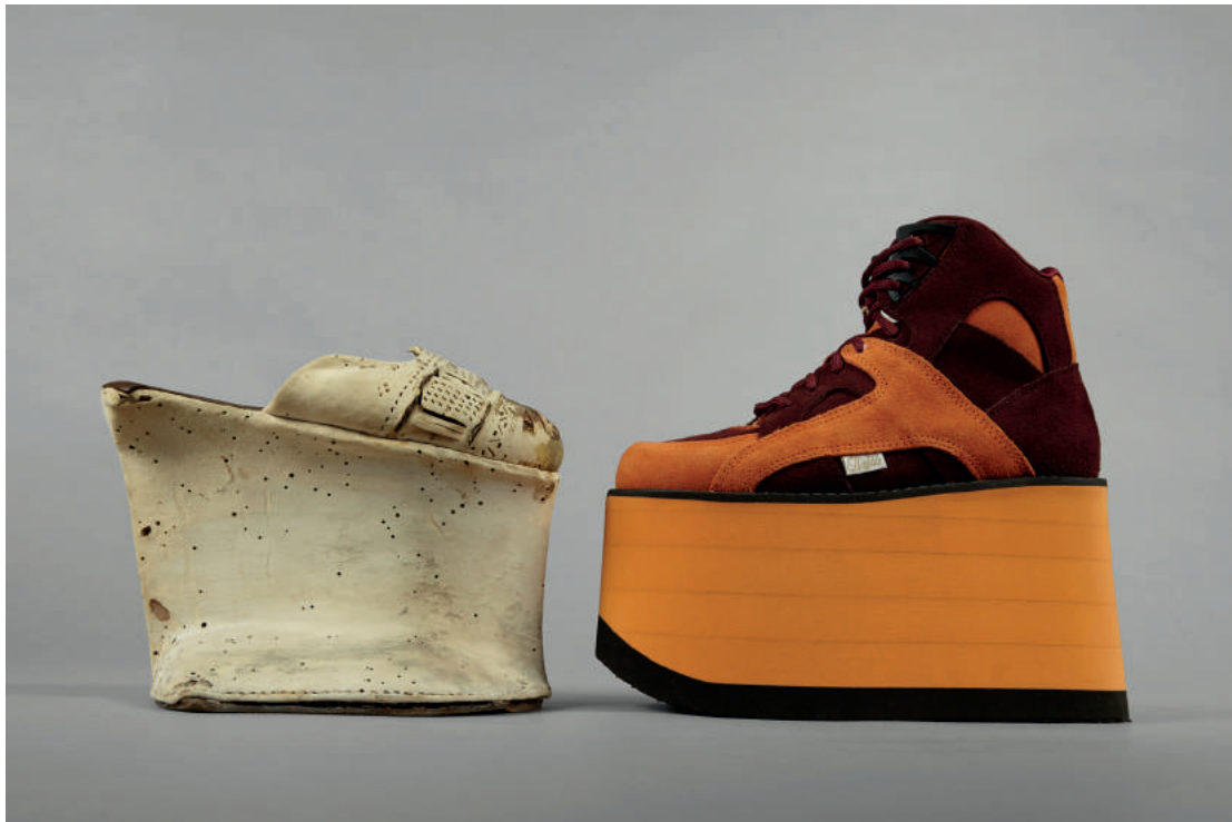
Chopine, Venedig, Italien, um 1600 und Plateauschuhe, Towers, Buffalo, Wiesbaden, 1996

DO 09 APR 18:30 WO DRÜCKT DER SCHUH? Die wechselhafte Geschichte eines Accessoires