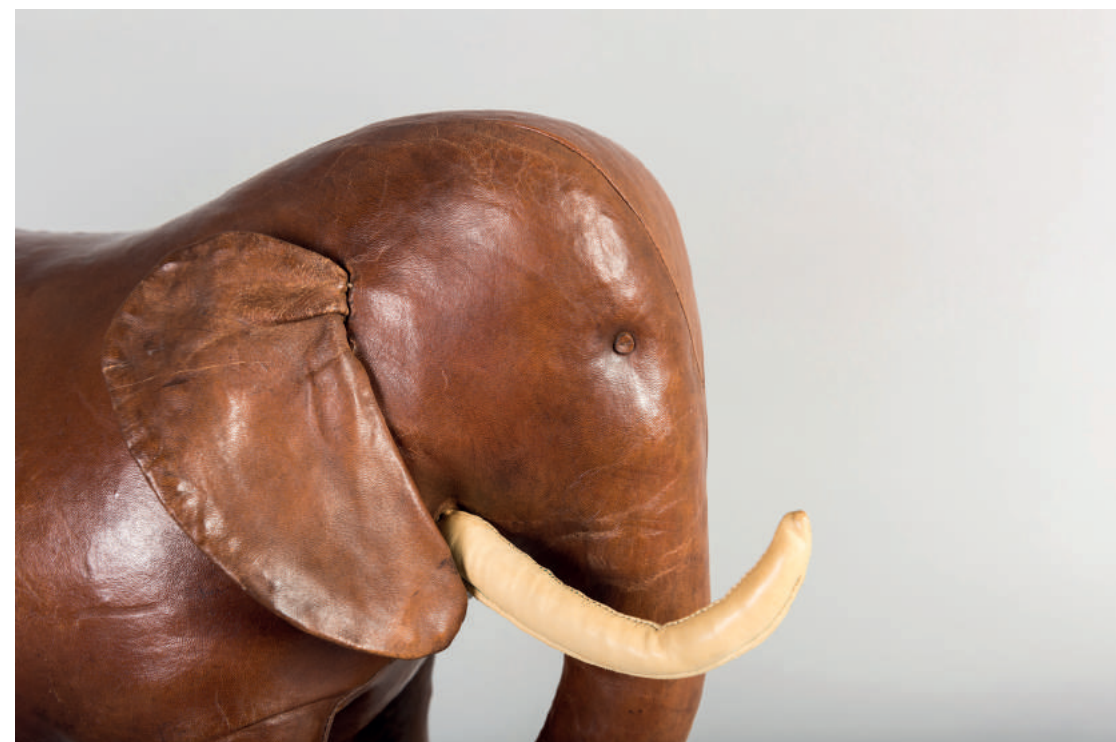
Elefant, Dimitri Omersa für Almazan, Spanien, 1960er/1970er-Jahre

S-Bahn S1, S2, S8 und S9 Station Ledermuseum, Ausgang Ludwigstraße Buslinien 103 und 120 Haltestelle Offenbach, Ludwigstraße/Ledermuseum Parkmöglichkeiten im City-Center Parkhaus am CinemaxX, Berliner Str. 206 – 216