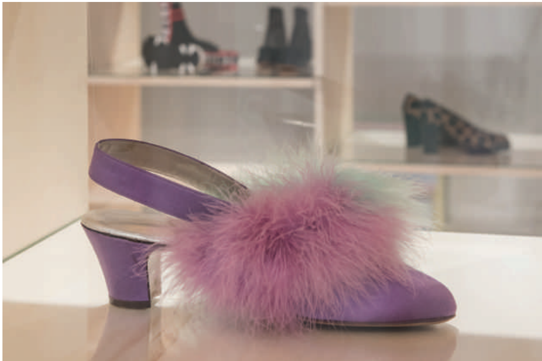
Slingpumps, Bally, Schönenwerd, Schweiz 1938

DO 8 OKT 18:30 NEU ERÖFFNET! Dr. Inez Florschütz führt durch die Ausstellung tierisch schön?