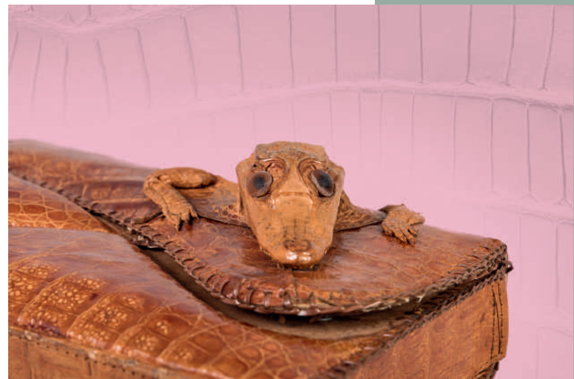
Handtasche, Südamerika, ca. 1970

Eintritt & Führung 10 €. Bitte melden Sie sich im DLM unter Tel. 069 829798-0 oder info@ledermuseum.de an.