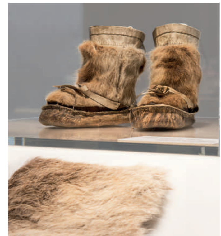
Kindertiefel der Iñupiat, Alaska, Anfang 20. Jahrhundert und Fühlstation „Rentierpelz“ im Projektraum DAS IST LEDER! Von A bis Z

Unter dem Motto „Anfassen erlaubt!“ laden Taststationen zum Erfühlen der unterschiedlichen Lederarten wie Rochenleder oder Ochsenfroschleder, aber auch der veganen und recycelbaren Stoffe wie Zunderschwamm-Pilz oder aus Ananasfasern gefertigtes Piñatex® ein. Über Medientische abrufbare Informationen geben Auskunft über die verschiedenen Gestaltungstechniken, die Besonderheiten des jeweiligen Materials sowie über lederverarbeitende Berufe. In einer Dreikanal-Videoinstallation im Kinosaal des DLM berichten lokale Akteur*innen aus der Stadt und aus dem Kreis Offenbach über ihr lederverarbeitendes Handwerk und stellen verschiedene Fertigungsprozesse vor.