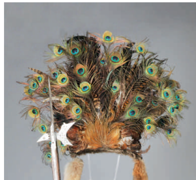
Tracht eines Saltners (Detail), Tirol, Österreich, 19. Jahrhundert