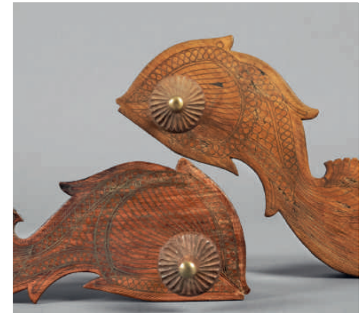
Zehenpflocksandalen (Padukas), Indien, 19. Jahrhundert

Ein weiteres besonderes Merkmal der Ausstellung ist die Gegenüberstellung von Schuhen aus der historischen Sammlung mit Exemplaren aus der zweiten Hälfte des 20. bzw. des 21. Jahrhunderts. Auf diese Weise werden Kontinuitäten sowie Brüche in der Entwicklung des Schuhs und des Schuhdesigns sichtbar.