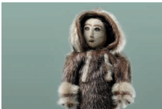
Puppe der Inuit, Artic Bay/Baffin Island, Nunavut, Kanada, um 1950

Eintritt & Führung 10 €. Bitte melden Sie sich im DLM unter Tel. 069 829798-0 oder info@ledermuseum.de an.