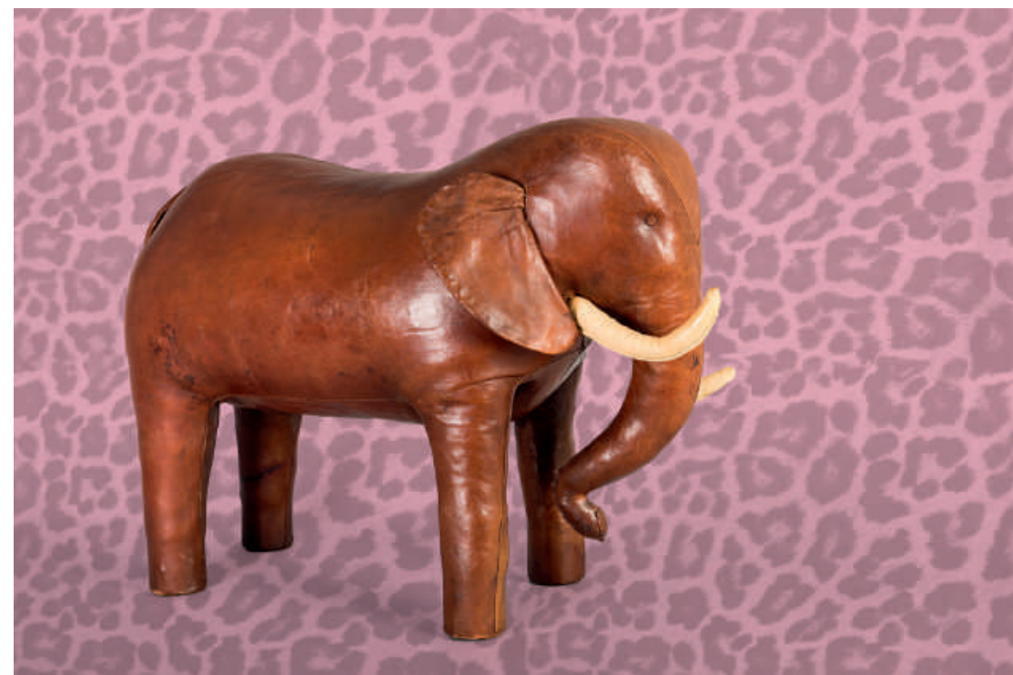
Möbelstück in Tierform, Dimitri Omersa für Almazan, Spanien, 1960er/70er-Jahre

S-Bahn S1, S2, S8 und S9 Station Ledermuseum, Ausgang Ludwigstraße Buslinien 103 und 120 Haltestelle Offenbach, Ludwigstraße/Ledermuseum Parkmöglichkeiten im City-Center Parkhaus am CinemaxX, Berliner Str. 206 – 216